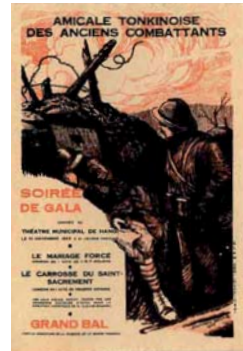
Affiche signée S. Bricq, 1927, fonds Claude Bourrin, Société d'Histoire du Théâtre.

Entre 1860 et 1960, le théâtre est embarqué dans l'entreprise coloniale, qu'il la serve ou la remette en cause. Cette relation entre théâtre et colonisation sera présentée à partir de deux archives qui racontent l'histoire du théâtre colonial et anticolonial : l'une, datée de 1927, issue du fonds Claude Bourrin, administrateur colonial en Indochine et directeur du Théâtre Municipal de Hanoï, l'autre, de 1933, issue des Archives de la Préfecture de Police présentant un arrêté d'interdiction de la pièce anticoloniale Bougres de Nah-Qués . Les différentes manières dont le théâtre a servi ou attaqué le système colonial seront ainsi abordées lors de cette séance.