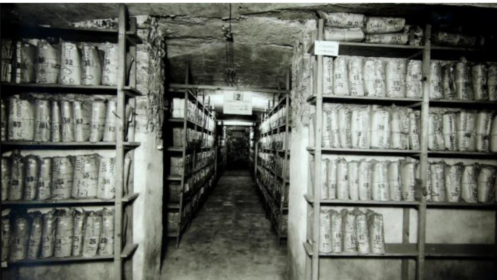
Archives de la préfecture d'Alger en 1934 (Archives nationales de France, AB-XXXI-C 293)

https://evento.renater.fr/survey/colloque-archives-fantomes-fantomes-d-archives-7s4nfwel